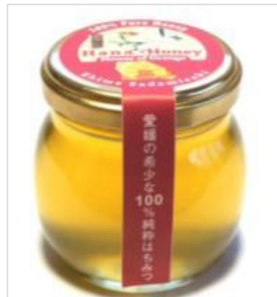
愛媛県「完熟屋」みかんの花はちみつ 1,080円(税込)※価格は変更になる場合があります。