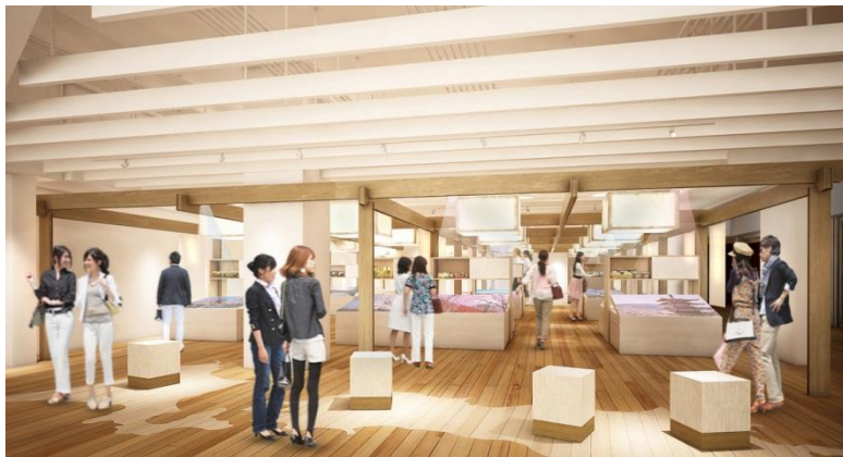
「【Event space】おすすめふるさと」イメージ