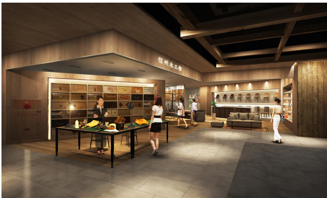
「信州木工館」イメージ

日本に古くからある自然療法や漢方などを通じて、香りの文化や歴史を広める「 まじりか 茉華」では、メディカルハーブコーディネーターの資格を持つオーナーが国内を10年以上渡り歩き厳選した、国産のアロマや化粧品、お香などをお買い求めいただけます。長野県の家具・木工雑貨店「信州木工館」は、県内の木工、ガラス、陶芸、織物、染物等の作家が持つ技を取り入れた引き出しを製作、個性的なタンスを販売します。また、古くから伝わる飯山仏壇や、木曾漆器に使われている蒔絵、沈金技術を取り入れた、きらびやかなギターや、オーダーメイドの椅子などを販売します。福島県の地域セレクトショップ「URUWASHI」からは、会津地区伝統工芸の会津塗を施した器や箸、会津本郷焼のマグカップや皿、会津木綿のコースター、テーブルクロスなど、テーブルウェア商品を販売します。伝統を活かした新しいモノづくりの一品をお買い求めいただけます。