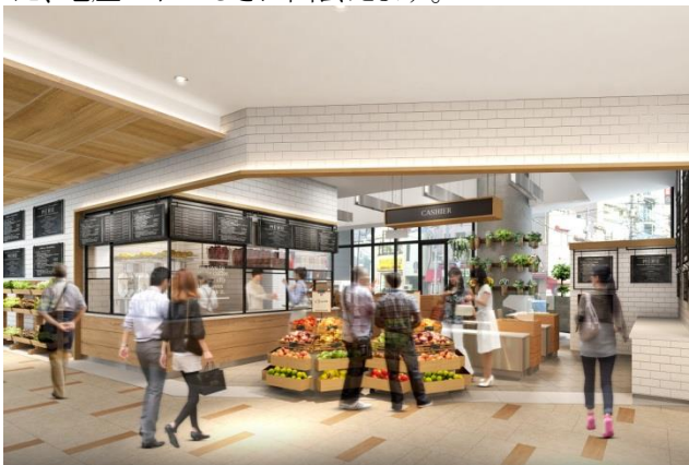
1階生鮮品店舗イメージ

食品館「蔵」では、問屋を通さない少量多品種の地方色豊かな商品をお買い求めいただけます。元・蔵人の女性バイヤーがセレクトした、東京でも流通量の少ない約300種の日本酒、国産ワインや焼酎などのアルコール類もお買い求めいただけます。愛媛県のはちみつ専門店「完熟屋」では、みかん畑で養蜂した、非加熱の天然はちみつを販売。後味にさわやかな、みかんの花の香りが残るのが特長です。新潟県からは魚沼産のできたておにぎりの販売や、精米したての厳選した15種類のお米を量り売り、新鮮な味わいをお楽しみいただける「いなほ新潟」、岩手県からは、気温の低い気候のなか「 まが た きんとき 曲田金時」を3週間天日干しにすることでしっとりとした濃厚な甘みで、生キャラメルのような食感が特徴の「 おうごんかんしよ 黄金甘藷」を販売します。作り手のこだわりが詰まった、地産のおいしさに出会えます。