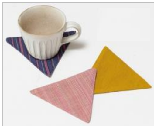
福島「URUWASHI」 会津本郷焼マグカップ 1,836 円（税込） 会津木綿コースター1,890 円（税込）