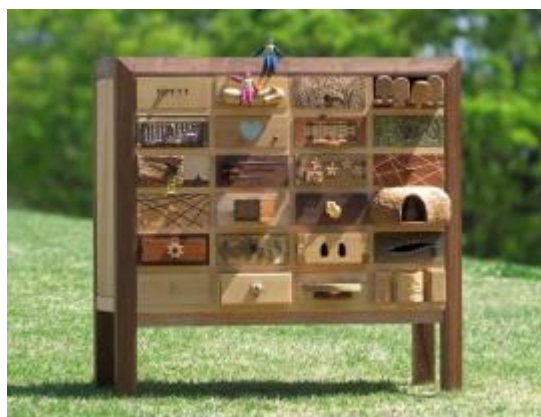
長野県「信州木工館」 引き出し 24（価格未定）