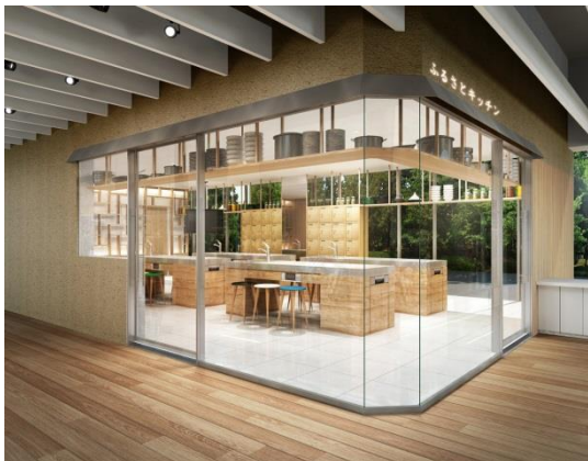
「【Cooking studio】おいしいのつくりかた」イメージ

なお、地域の誘客の足掛かりとなるシティプロモーションの場「【Event space】おすすめふるさと」は、現在、出展市町村を選出中で、10月中旬に発表予定です。