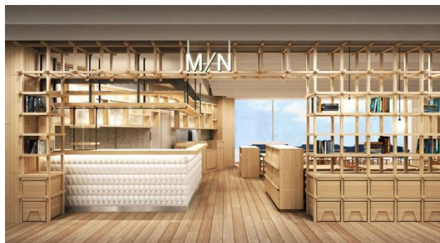
「【Cafe】M/N エム エヌ 」イメージ

「【Cafe】M/N エム エヌ 」では、「【Event space】おすすめふるさと」出展市町村の食材を用いた、コラボレーションメニューの開発を行います。例えば、鹿児島県薩摩川内市の黒豚と、兵庫県洲本市のたまねぎを使ったカレーなど、それぞれの素材のおいしさが最大限に生きるよう調理法をご提案し、旬の食材を生かしたメニューの開発を行います。