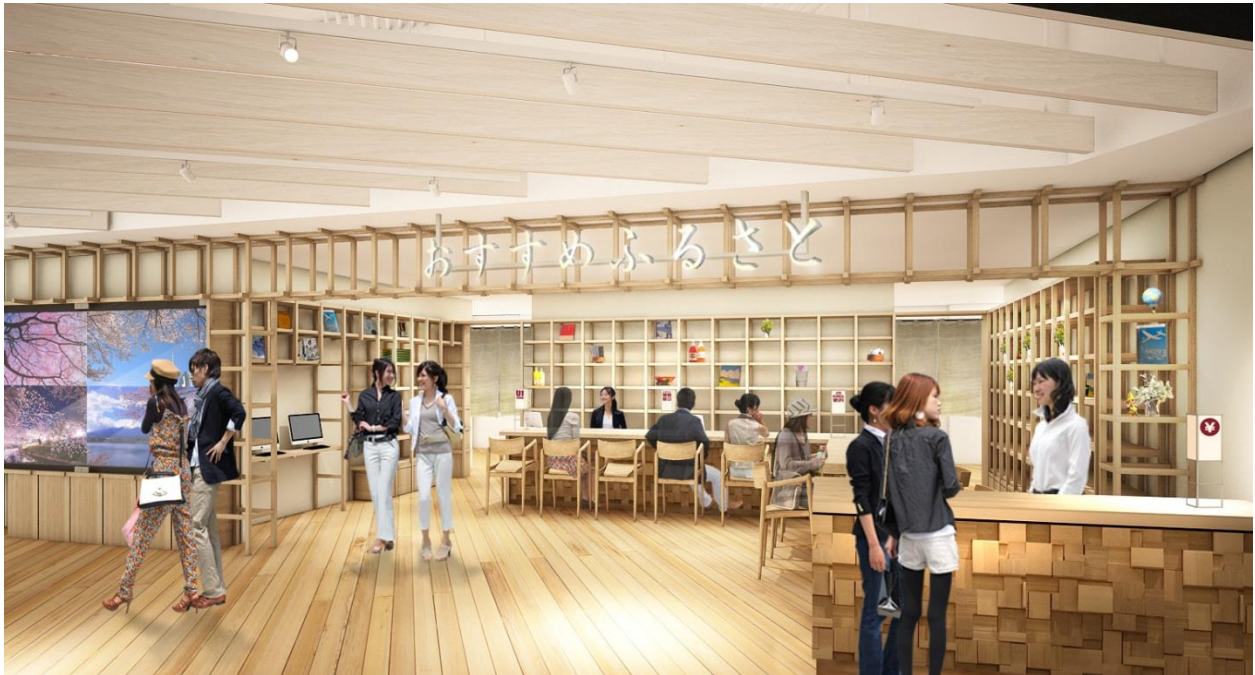
「おすすめふるさと さろん」イメージ

「【Event space】おすすめふるさと」内には、来館者と地方を「モノ」「コト」「ヒト」でつなぐサービス窓口「おすすめふるさと さろん」を設置します。