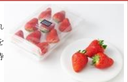
「うずしおベリー」1080円(税込)

徳島県発のれんこん加工食品店『れんまる』では、徳島県ウチノ海で収穫された牡蠣から作られた牡蠣殻パウダーの肥料使って育てた苺「うずしおベリー」を販売。カルシウムなどの栄養素を与えることで、実が大きく甘みがあるのが特徴です。自然に優しい徳島県ならではの海の恵みを受けた苺です。