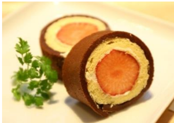
「とちおとめの恵方ロール」864円(税込)

『Café M/N』では、栃木産の“とちおとめ”をまるごと使用した、恵方ロールケーキを販売します。ココアパウダーのクレープでロールケーキを包み、恵方巻きに見立てています。カフェタイムにもぴったりの恵方ロールで、今年の節分は福を呼び込むのはいかがでしょうか。