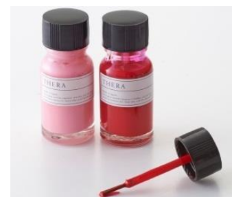
「THERA manu& pedi cure emulsion」 左：からくれない 右：つまくれない 各 1836 円 (税込)

健康美容商品のセレクトショップ『茉華 matsurica』では、ホタテの貝殻由来の胡粉を使用した、ここでしか手に入らないネイルカラーを販売しています。自然成分由来のため、爪にも優しく、一塗りでもみずみずしいカラーをお楽しみいただける、発色の良さと、速乾性が特徴です。有機溶剤不使用なので油性ネイルのシンナーのにおいがせず、お湯でオフできる一品です。