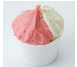
「ジェラート2種(いちご・生姜)」450円(税込)

愛媛県発のナチュラルジェラート・ジュースの店『スマイル&スイーツ』では、愛媛県内子町の農家さんが栽培した食材を使用し、手作りでジェラートを生産。定番の“いちご”の他、季節限定で“生姜”も登場。野菜が持つ、辛みや酸味、食感といった、素材そのものを感じられるジェラートをお楽しみいただけます。