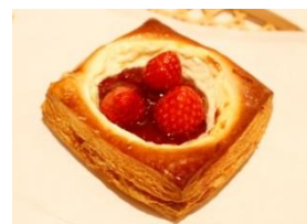
「いちごのフルーツクロワッサン」 302 円 (税込)

米粉パン店『壘 ichi』では、「いちごのフルーツクロワッサン」を販売。米粉を使用したクロワッサン生地はもちもちの食感で、菓子パンなのに重くないのが特徴です。甘酸っぱいいちごと、さわやかな酸味のヨーグルトソースとの相性も抜群です。