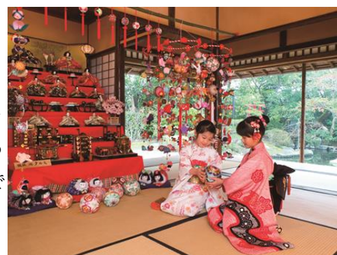
福岡県柳川市のお雛祭りの様子

まるごとにつぼんでは、3 階では、1 月 22 日 (金) から 3 月 6 日 (日) まで、7 段のお雛様と「さげもん」を展示します。