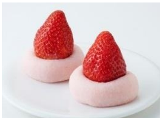
「いちご大福」360円(税込)

香川県発の和菓子店『松風庵かねすえ』では、4cm程度の大きな苺を選んで、各地から取り寄せています。中のいちご餡は、白あんといちごを練りこんでいます。上に乗っているいちごの甘酸っぱさにぴったりです。