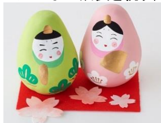
「ひなペア 色衣」 4104 円 (税込)

福島県発のセレクト雑貨店『URUWASHI』では、「転んでも起き上がるところから忍耐と人生の象徴」として 400 年前から人々に愛されている起き上がり小法師を販売しています。会津最古の民芸品が、かわいらしいお雛様として登場です。