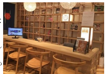
ふるさと納税コンシェルジュ窓口