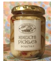
きくちピクルス菊芋 (702 円税込)

「おすすめふるさと」では、開業時から熊本県菊池市の PR ブースを設けています。菊池市名産の菊芋を使った、しゃきしゃきとした食感が人気の「きくちピクルス菊芋」や、生産者がわずか7人といわれる、幻のしいたけで作った辛子漬け「からしいたけ」などを販売しています。