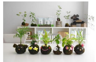
見た目も可愛いオリジナル苔玉