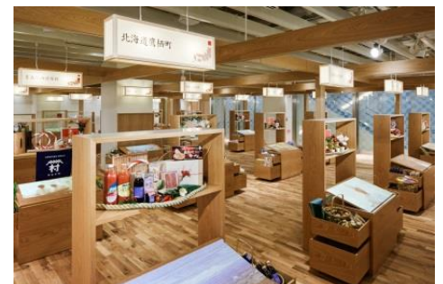
「【Event space】おすすめふるさと」