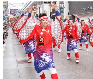
高知市のよさこい祭り