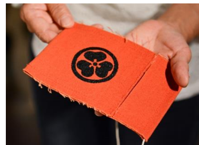
好きな色の生地と型を選んで作れるオリジナルポーチ