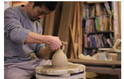
越前焼の製作風景

「【Event space】おすすめふるさと」では、各市町村の特産品を販売できるふるさとPRブースの運営のみならず、自治体主催のイベントや物産展の開催、「まるごとにつぼん」館内のカフェや料理教室でコラボレーションメニューを開発・提供するなど、それぞれの市町村の課題に合わせたPR施策が可能です。「【Event space】おすすめふるさと」では、今後も切磋琢磨しながら一丸となって各地域の発信力を高めることで、全20市町村それぞれの現地へ誘客を目指します。